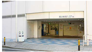
◀ 立体駐車場入り口